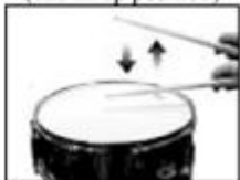
Full Stroke (start in up position) (end in up position)