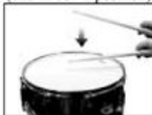
Down Stroke (start in up position) (end in down position)